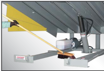
Diseño con CleanSweep Frame