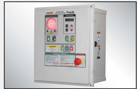
iDock Controls mejorados opcionales con pantalla de mensajes interactiva y que se pueden integrar con cualquier otro equipo de andén.